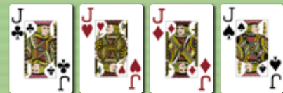
Vierling (Poker, four of a kind)