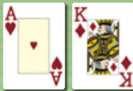
Die höchste Karte (high card)

Die Rangfolge der Kartenkombinationen ist in aufsteigender Wertigkeit wie folgt: