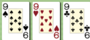
Drilling (three of a kind)