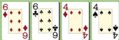
Zwei Paare (two pairs)